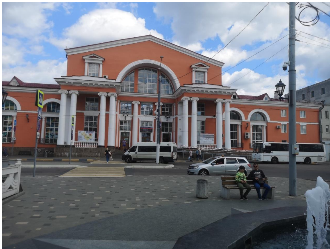
Ф7. Центральный фрагмент главного юго-западного фасада здания