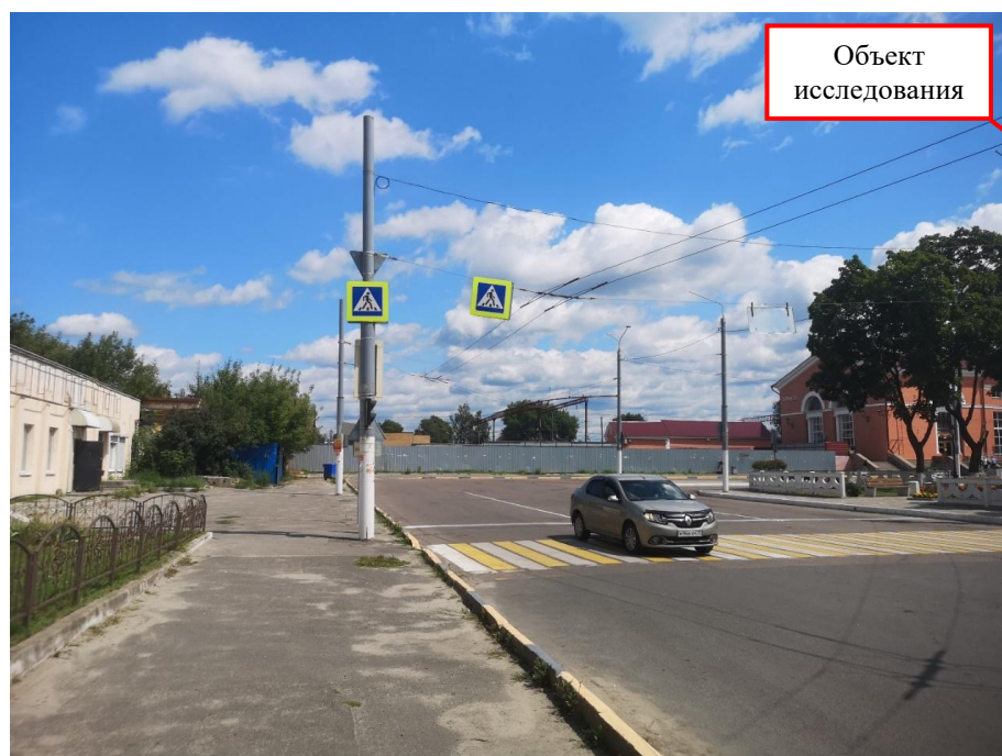
Ф2. Общий вид с северо-запада