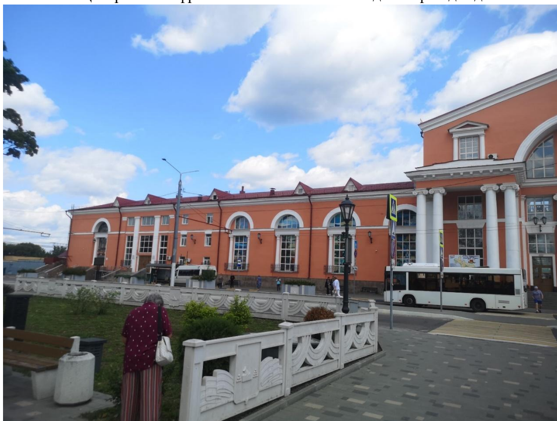
Ф8. Вид на главный юго-западный фасад здания