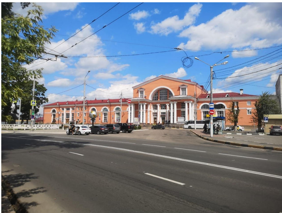
Ф6. Вид на главный юго-западный фасад здания