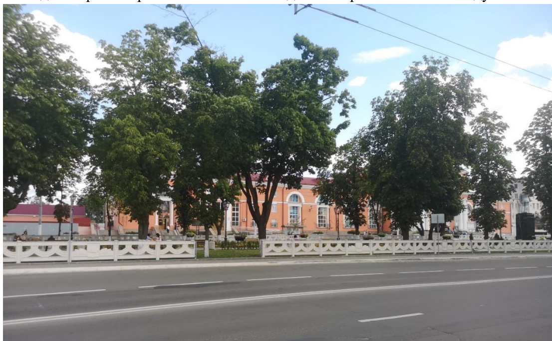
Ф4. Вид на главные фасады здания, направление с севера на юг