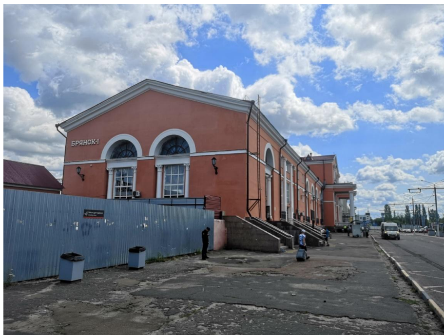
Ф1. Вид на северо-западный фасад здания