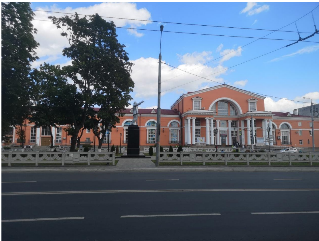
Ф5 Вид на главный юго-западный фасад здания