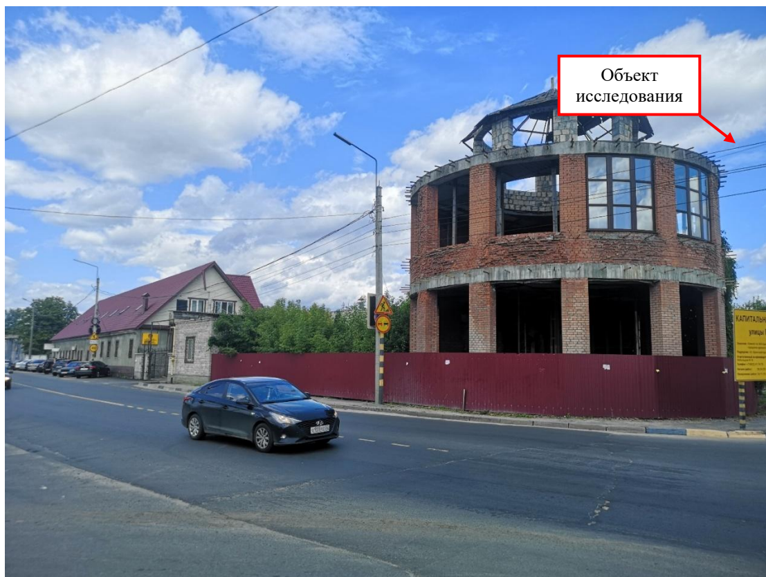
Ф3. Вид на строение расположенное в западном направлении от исследуемого ОКН